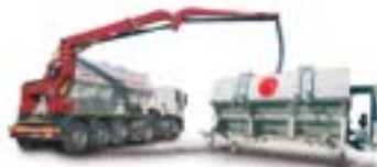
SISTEMA DI RIFORNIMENTO CISTERNA